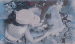
PECHE A L'EPUISETTE