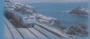
TER DE LA POSIDONIE

Agrément académique du Ministère de l'Education Nationale Agrément Jeunesse - Education Populaire Agrément Sport du Ministère de la Santé, de la Jeunesse et des Sports Association affiliée à la FFESSM